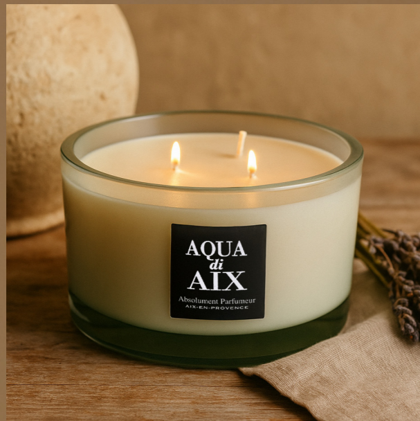
Aqua di Aix

WYPEŁNIJ SWÓJ DOM PIĘKNYM ZAPACHEM COUTURE